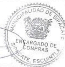
Elder Pineda Encargado de Compras