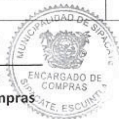
Eider Pineda Encargado de Compras