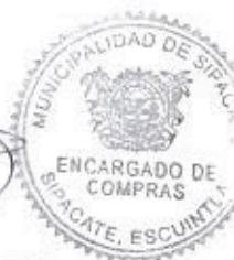
Elder Pineda Encargado de Compras