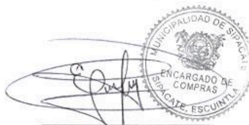
Elder Pineda Encargado de Compras