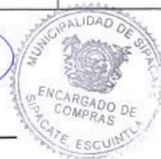
Elder Pineda Encargado de Compras