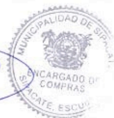
Elder Pineda Encargado de Compras