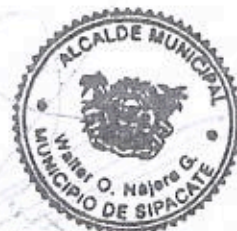
Nombre y Cargo Firma y sello

ELEVATEC Elevaciones Técnicas, S.A. 2 Calle 3-21, Zona 13 PBX: (502) 2388-0000