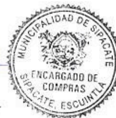
Elder Pineda Encargado de Compras