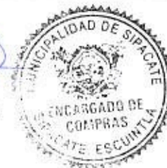
Elder Pineda Encargado de Compras