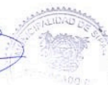
Elder Pineda Encargado de Compras