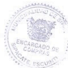
Eder Pineda Encargado de Compras