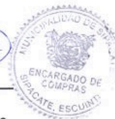
Elder Pineda Encargado de Compras