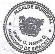
Nombre y Cargo Firma y sello

ELEVATEC Elevaciones Técnicas, S.A. 2 Calle 3-21, Zona 13 PBX: (502) 2388-0000