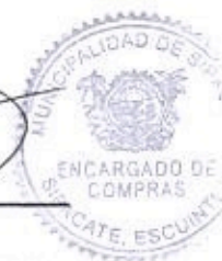
Elder Pineda Encargado de Compras