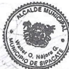
Nombre y Cargo Firma y sello

ELEVATEC Elevaciones Técnicas, S.A. 2 Calle 3-21, Zona 13 PBX: (502) 2388-0000