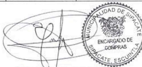
Elder Pineda Encargado de Compras