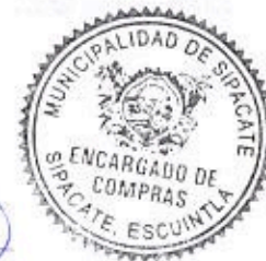
Elder Pineda Encargado de Compras