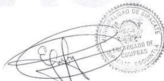
Elder Pineda Encargado de Compras