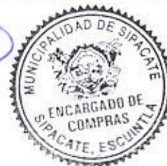
Elder Pineda Encargado de Compras